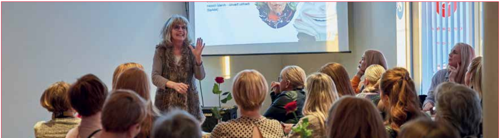
Edda á fullu gasi - og athyglin óskipt.