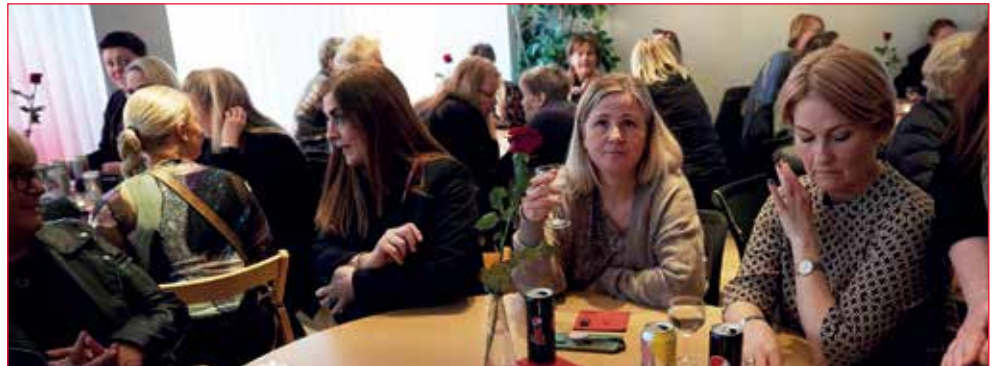
Fullt hús í Samfylkingarhúsinu.