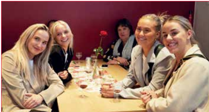
Ungar jafnarðarkonur í góðum gir!